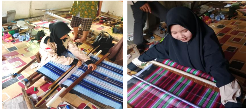
Gambar 2. Proses Pembuatan Sarung Tenun Khas Buton