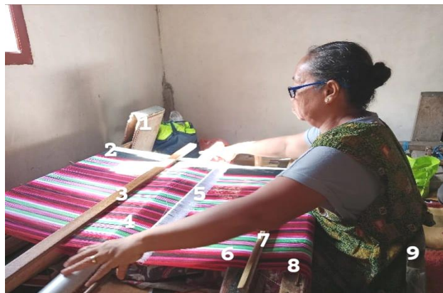
Gambar 4. Proses menenun Sarung Tenun Khas Buton oleh Pekerja.

Adapun alat yang digunakan dalam pembuatan kain tenun khas Buton terdiri atas beberapa bagian yang memiliki fungsi masing-masing, yaitu (a) Pakua yang berfungsi sebagai penyangga papan penggulung, (b) papan penggulung yang berfungsi sebagai penggulung benang, (c) Kantaburi yang berfungsi sebagai penjepit benang, (d) Liwuo, (e) Pando-Pando yang berfungsi sebagai pengatur benang, (f) Baliga (Pedang) yang berfungsi untuk merapatkan benang, (g) Jangka (Sisir), (h) Kakuti, dan (i) Kakundo yang berfungsi sebagai penyangga bagian belakang penenun. Setiap alat tersebut memiliki peran penting dalam mendukung proses pembuatan kain tenun sehingga menghasilkan tenunan yang rapi dan berkualitas.