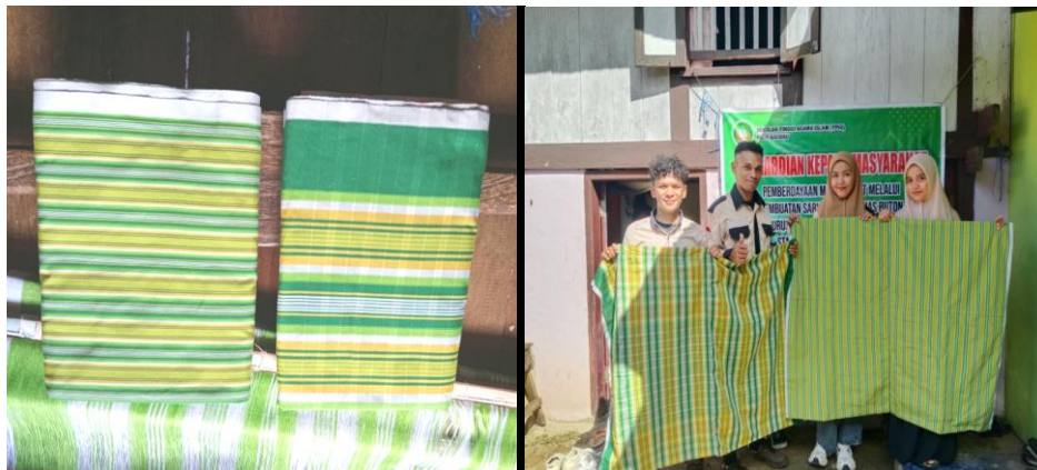
Gambar 1. Motif Sarung Tenun Khas Buton

Dengan mengintegrasikan semua elemen ini, kita dapat membangun sebuah ekosistem yang tidak hanya memberdayakan pengrajin, tetapi juga meningkatkan daya saing produk kerajinan lokal di pasar global. Kesuksesan industri tenun Buton tidak hanya akan berdampak pada pengrajin itu sendiri, tetapi juga pada masyarakat luas, menciptakan lapangan kerja baru, dan meningkatkan perekonomian lokal secara keseluruhan.