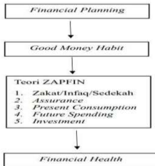
Gambar 2. Kerangka Berpikir