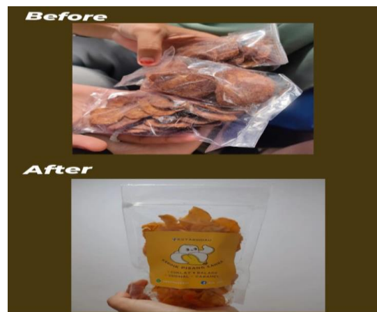
Gambar 4. Tampilan produk sebelum dan sesudah pendesainan logo

Pengabdian kepada masyarakat melalui Program Membangun desa Mandiri Kampus Merdeka kami mendesain logo terhadap UMKM Zahra. Dengan pembuatan logo produk kepada UMKM Keripik Pisang Zahra, UMKM ini dapat menggunakan logo tersebut sebagai salah satu identitas dari produk UMKM Zahra yang dapat membantu dalam meningkatkan branding produk serta dapat menjadi salah satu merek dari produk UMKM Zahra agar konsumen dapat mengenali dan mengingat produk tersebut.