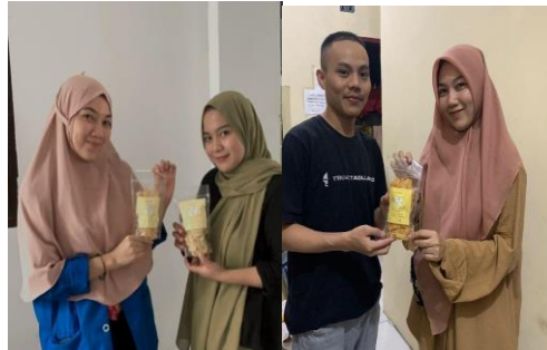
Gambar 1. Promosi secara door to door

Adapun jangkauan calon pelanggan yang kami dapat jangkau yaitu masyarakat sekitar desa Kotarindau, teman-teman mahasiswa universitas Tadulako, serta beberapa pelanggan di daerah kota Palu.