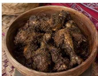
Gambar 2. Ayam Napinadar sebagai kuliner khas Batak Toba

Teknik pemanggangan tradisional menjadi salah satu karakteristik penting dalam pengolahan Ayam Napinadar karena mampu memperkuat aroma dan cita rasa daging. Setelah proses pemanggangan selesai, ayam dicampurkan dengan bumbu halus yang terdiri atas andaliman, cabai, bawang merah, bawang putih, jahe, dan rempah lainnya. Berdasarkan hasil wawancara, sebagian pelaku usaha mulai menggunakan kompor gas sebagai bentuk adaptasi modern untuk meningkatkan efisiensi produksi. Penggunaan api kayu masih dianggap menghasilkan cita rasa yang lebih autentik dibandingkan metode modern.