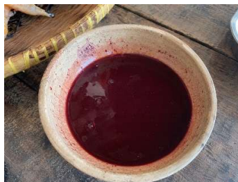
Gambar 3. Penggunaan darah ayam (gota) sebagai bahan khas dalam Ayam Napinadar

Secara historis, Ayam Napinadar telah lama menjadi bagian penting dalam kehidupan masyarakat Batak Toba, khususnya dalam berbagai kegiatan adat dan ritual budaya. Berdasarkan wawancara dengan tokoh adat, Ayam Napinadar biasanya disajikan dalam acara kelahiran, dan kematian sebagai simbol doa, penghormatan, serta ungkapan rasa syukur. Penggunaan darah ayam dalam pengolahannya memiliki makna simbolik sebagai representasi kehidupan dan pengorbanan. Selain itu, penyajian Ayam Napinadar juga berkaitan erat dengan nilai kekerabatan dalam sistem sosial masyarakat Batak Toba. Dalam hal ini, makanan tidak hanya berfungsi sebagai konsumsi, tetapi juga sebagai media simbolik yang memperkuat hubungan sosial dan identitas budaya masyarakat. Temuan ini sejalan dengan konsep etnogastronomi yang menyatakan bahwa makanan memiliki keterkaitan erat dengan nilai budaya, tradisi, dan praktik sosial Masyarakat (Rizkiyah et al., 2025; Sunuantari et al., 2019).