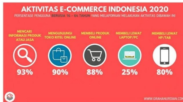
Gambar 5. Aktivitas E-commerce Indonesia 2020

jumlah karyawan, jenis barang/jasa yang dijual, media yang digunakan, cara penyampaian produk/jasa, dan mengapa mereka tidak menjual secara online.