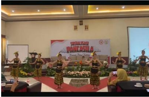
Gambar 4. Busana 1.

juga rok. Dalam pertunjukannya tarigerombyang pemalang memiliki dua perbedaan dalam aksesoris kepala, ada yang menggunakan piring dan sate kerbau, namun ada juga hanya yang menggunakan janur. Meskipun berbeda, namun makna yang terdapat pada tata busana tetap sama yaitu untuk memerindah penampilan.