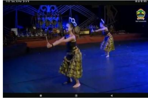
Gambar 5. Busana 2