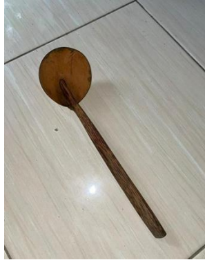
Gambar 11. Irus.