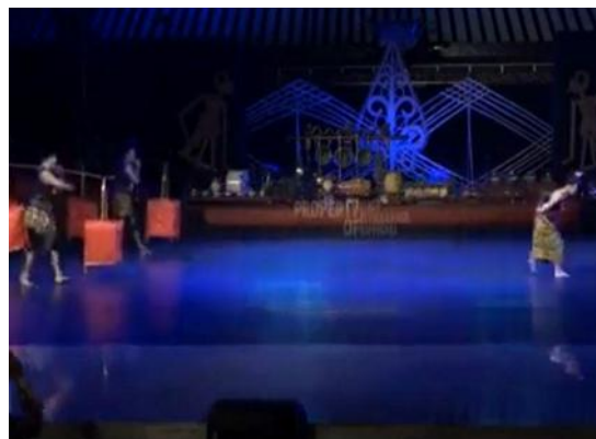
Gambar 10. Pergantian penari.