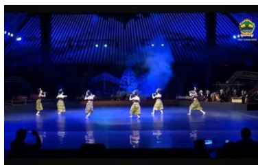
Gambar 1. Pola masuk tari grombyang pemalang.

Pada awal pertunjukan tari grombyang pemalang penari wanita masuk dengan diiringi lagu tari grombyang pemalang yang bermusik “ grombyang grombyang grombyang, grombyang ” dengan pola lantai membentuk lingkaran kemudian penari melakukan geolan.