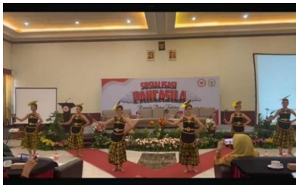
Gambar 2. Gerakan inti tari grombyang pemalang.

bagian pinggan penari yang dapat memudahkan penari untuk mengambil propertinya.gerakan inti diawali dengan pengambilan property irus kemudian properti digunakan layaknya irus yang digunakan untuk meyiduk kuah grombyang pemalang kemudian diayunkan dengan irama sebagai penambah unsur estetika dalam sebuah tarian