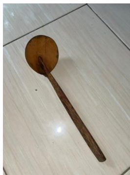
Gambar 6. Irus.

Properti merupakan semua perlengkapan yang digunakan dalam pertunjukan tari, baik yang digunakan penari sebagai pendukung tarian atau hanya yang diletakkan diatas panggung untuk mendukung visual tarian.(Nur Dianti and Lanjari 2025). Tari grombyang pemalang sendiri menggunakan satu properti utama yaitu irus atau centong sayur ( alat untuk menciduk atau mengambil kuah).