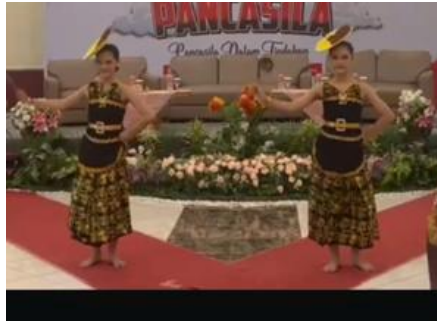
Gambar 9. Hiasan kepala.