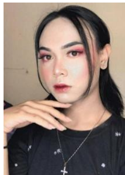
Gambar 3. Tata Rias Cantik.