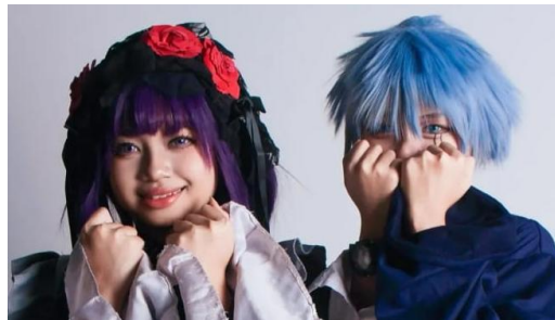
Gambar 2. Cosplayer Mahasiswa Universitas Surabaya.

Cosplay menggambarkan aktivitas yang menyerupai tokoh idola, baik melalui cara berpakaian maupun perilaku yang merepresentasikan karakter anime, manga, dan video gim. Dalam praktiknya, para peserta yang disebut cosplayer merias wajah dan menggunakan kostum sesuai dengan karakter yang mereka gemari. Saat melakukan cosplay, para cosplayer memainkan peran yang berbeda dari kesehariannya, sehingga diri yang ditampilkan merupakan the presenting self (Venus & Helmi, 2010). Hal ini dapat dilihat pada tampilan cosplay mahasiswa saat pelaksanaan Mata Kuliah Fotografi, Program Studi Desain Komunikasi Visual, Fakultas Industri Kreatif, Universitas Surabaya, ditunjukkan pada Gambar 2.