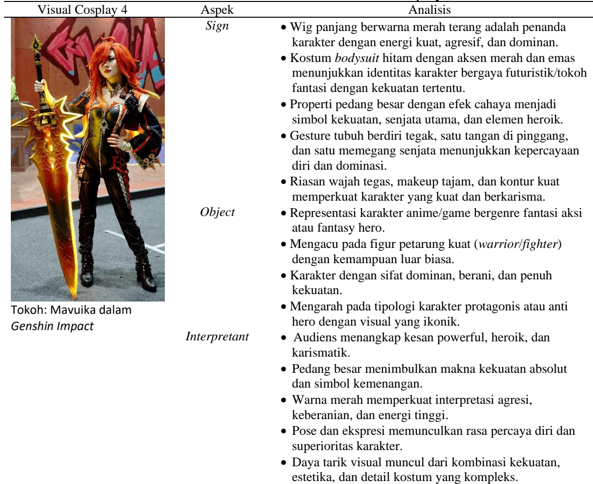
Tabel 5. Analisis Tanda Visual Karakter Cosplay 4.

Visualisasi tokoh Mavuika (Tabel 5), menunjukkan relasi yang kuat antara sign , object , dan interpretant dalam membangun makna visual yang berorientasi pada kekuatan dan heroisme. Elemen-elemen visual dari Mavuika seperti wig merah terang, kostum bodysuit dengan aksen kontras, serta properti pedang besar yang menyala berfungsi sebagai sign yang membentuk identitas karakter secara tegas dan dominan. Tanda-tanda tersebut merujuk pada object berupa figur karakter fantasi bergenre aksi yang memiliki kekuatan besar, keberanian, dan peran sebagai petarung utama. Sementara itu, interpretant yang muncul dalam benak audiens adalah kesan karakter yang powerful, karismatik, dan heroik, yang diperkuat oleh pose tubuh yang percaya diri serta penggunaan warna yang intens. Dengan demikian, daya tarik visual dalam foto ini terletak pada kemampuan cosplayer dalam merepresentasikan kekuatan karakter melalui elemen visual yang dramatis dan ikonik, sehingga menghasilkan pengalaman visual yang kuat dan memikat.