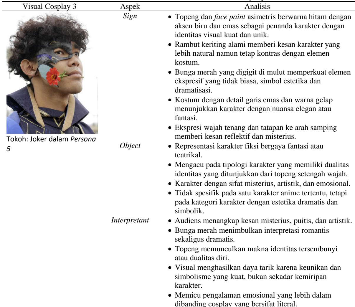
Tabel 4. Analisis Tanda Visual Karakter Cosplay 3.

Berdasarkan pendekatan semiotika Charles Sanders Peirce, visualisasi tokoh Joker (Tabel 4) memperlihatkan relasi yang kuat antara sign , object , dan interpretant dalam membangun makna visual yang bersifat simbolik dan ekspresif. Elemen-elemen seperti topeng asimetris dengan aksen warna kontras, bunga merah yang digigit, serta kostum bernuansa gelap dengan detail elegan berfungsi sebagai sign yang membentuk identitas visual karakter. Tanda-tanda tersebut merujuk pada object berupa figur karakter fiksi dengan tipologi fantasi yang menonjolkan dualitas identitas, sifat misterius, dan kedalaman emosional.