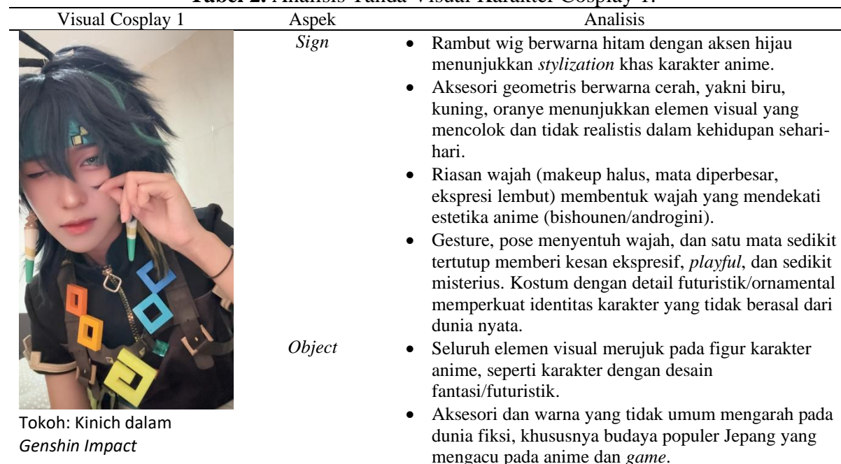
Tabel 2. Analisis Tanda Visual Karakter Cosplay 1.

Kerangka semiotika Peirce dalam penelitian ini digunakan sebagai alat analisis untuk mengkaji bagaimana elemen-elemen visual pada karakter anime dikonstruksi dan diinterpretasikan oleh para cosplayer, sehingga dapat dipahami bentuk daya tarik visual yang muncul dalam relasi antara tanda, makna, dan audiens.