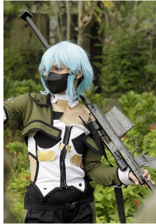
Tokoh: Asada Shinon dalam Sword Art Online