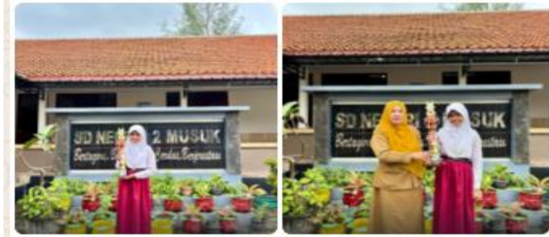
Gambar 2. Juara Lomba

Hal ini senada dengan yang diungkapkan salah satu orang tua siswa yaitu Suyati (orang tua siswa kelas 6, hasil wawancara tanggal 13 Oktober 2025), menjelaskan bahwa dengan mengikuti ekstrakurikuler Drumband anak saya menjadi lebih fleksibel dalam berinteraksi dengan orang yang baru dikenal, dan kepercayaan dirinya menjadi meningkat.