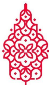
Gambar 1. Gunungan Wayang

Konfigurasi garis yang mengerucut dan meruncing pada bagian atas logo G20 Indonesia 2022 merupakan bentuk alamiah ( pure forms ) dari sebuah Gunungan Wayang. Konfigurasi garis yang meruncing pada bagian atas ini menyerupai sebuah segitiga. Bentuk tersebut menjadi sebuah representasi objek alamiah ( natural meanings ) dari bentuk gunung api. Bentuk yang memiliki konfigurasi garis seperti ini dinamakan sebagai gunungan. Konfigurasi garis yang meruncing seperti gunung api pada bagian atas dan lekukan yang tampak pada logo G20 Indonesia 2022 mendeskripsikan gunungan yang biasa digunakan dalam pewayangan, sehingga disebut dengan Gunungan Wayang. Bentuk Gunungan Wayang diperlihatkan secara jelas di dalam logo G20 Indonesia 2022, bahkan bentuk ini menjadi bentuk utama pada logo. Disamping itu, bentuk Gunungan