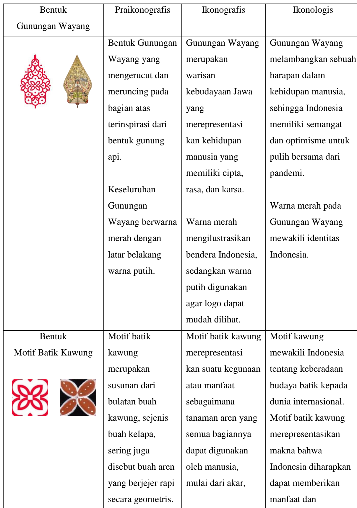
Tabel 1. Bentuk dan Representasi Budaya dalam Logo G20 Indonesia 2022