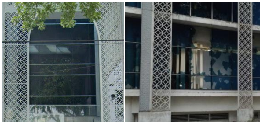
Gambar 6. Penerapan Ornamen pada Gedung DPRD.

Fasad gedung DPRD menerapkan ornamen dengan bentuk-bentuk geometris yang dirangkai berupa bentuk lingkaran dan belah ketupat yang disimetriskan.