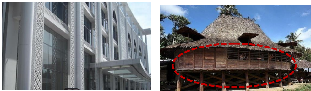
Gambar 5. Penerapan Irama.

bangunan terlihat rapi dan simetris. Pengulangan juga diterapkan pada fasad bangunan-bangunan pendukung.