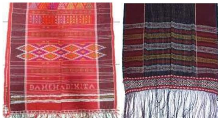
Gambar 7. Ornamen Geometris pada Ulos Batak.

Sedangkan pola belah ketupat memiliki makna keseimbangan, kebersamaan, kesatuan, keharmonisan dan spiritual. Kesimetrisan dalam belah ketupat menjadi simbol keseimbangan dengan masyarakat maupun alam. Kesimetrisan ini juga merupakan simbol persatuan, kerja sama dan keharmonisan. Belah ketupat juga memiliki makna spiritual yang berpusat pada bagian tengah diartikan sebagai ruang suci dari kekuatan gaib yang meliputi masyarakat Batak. Ornamen lingkaran dan belah ketupat pada masyarakat Sumatera Utara memiliki nilai-nilai dan simbol yang menjadi cerminan identitas budaya yang sudah seharusnya dilestarikan.