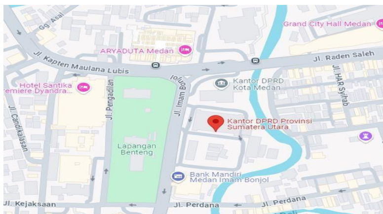
Gambar 2. Lokasi Gedung DPRD Sumut.

Pada penelitian ini penulis melakukan identifikasi khususnya pada fasad bangunan gedung DPRD Sumut. Terdapat beberapa elemen fasad yang akan dihubungkan dengan arsitektur tradisional untuk proses identifikasi.