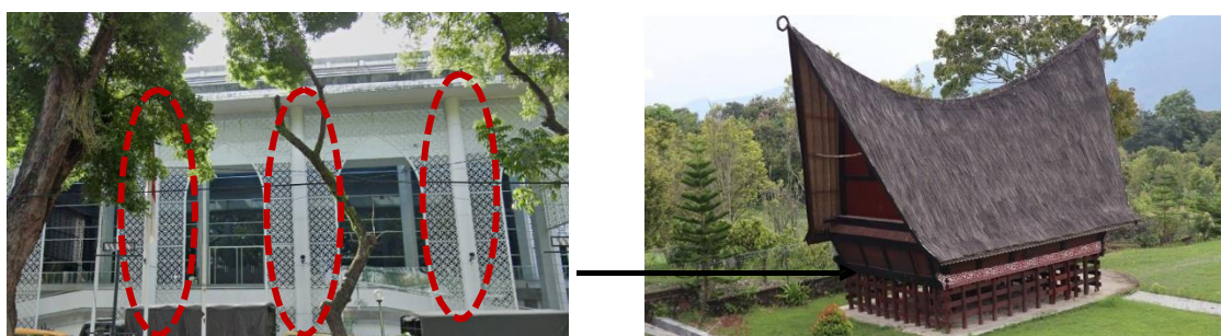
Gambar 4. Penerapan Tiang Ekspos pada Fasad.

Dalam arsitektur neo vernakular Sumatera Utara penerapan kolom-kolom ekspos yang di finishing dengan pelapis aluminium composite panel (ACP) ini merupakan bentuk penerapan arsitektur neovernakular yang sering di terapkan pada rumah-rumah adat Sumatera Utara salah satunya rumah adat Bolon . Pada rumah adat Bolon kolom atau tiang ekspos ini memiliki makna sebagai simbol kekuatan dan harapan agar bangunan dapat selalu berdiri kokoh dan tegak. Tiang- tiang yang berdiri kokoh juga merupakan bentuk pilar peradaban budaya batak yang harus dipertahankan hingga generasi selanjutnya. Kolom-kolom tinggi ini juga sebagai simbol kejujuran dan keadilan agar setiap penghuni bangunan selalu penuh kejujuran.