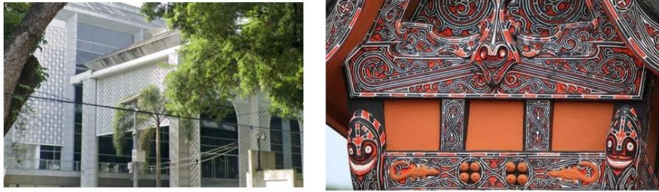
Gambar 9. Warna pada Gedung DPRD Sumut.

dengan warna lain seperti merah dan hitam yang membentuk keselarasan lambang aspek-aspek kehidupan seperti kekuatan dan kewibawaan.