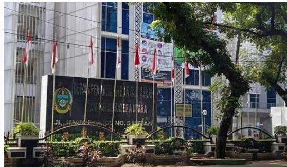
Gambar 1. Gedung DPRD Sumut.

Gedung DPRD Sumut merupakan gedung yang direncanakan tahun 2008 namun pembangunan di mulai pada tahun 2010 dan selesai pada tahun 2010. Gedung DPRD Sumut berlokasi di Jl.Imam Bonjol kota Medan. Arsitek yang merancang gedung DPRD Sumut adalah BOY BRAHMAWANTA SEMBIRING. Pada saat pembangunan gedung ini memakan biaya hingga 185 miliar rupiah. Gedung ini merupakan gedung yang dibangun untuk menggantikan gedung DPRD lama yang berada di lokasi yang sama. Berdasarkan pengumpulan data oleh penulis, diketahui gedung DPRD baru ini lebih menggunakan konsep perpaduan modern dan tradisional. Hal itu dapat dilihat dari penggunaan fasad full kaca dan aluminium composite panel (ACP). Gedung DPRD Sumut memiliki luas 8.737 meter persegi pada lahan 29.000 meter persegi.