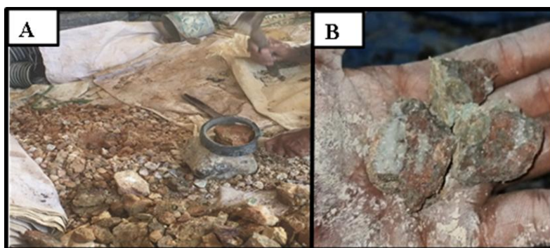
Gambar 2. A. Proses Reduksi Ukuran B. Hasil Setelah Reduksi

Proses ekstraksi emas di wilayah pertambangan rakyat dilakukan dengan metode amalgamasi dan flotasi. Tahapan kegiatan pertama adalah kegiatan kominusi (Gambar 2), kemudian kegiatan kedua proses amalgamasi dan flotasi yang berlangsung di dalam tabung (Gambar 3) dan terakhir adalah kegiatan pemanasan (Gambar 4) sehingga akhirnya didapat konsentratnya.