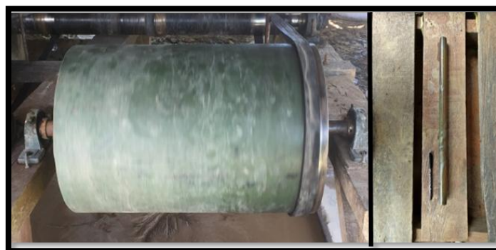
Gambar 3. A. Tumbling Mill B. Grinding Media