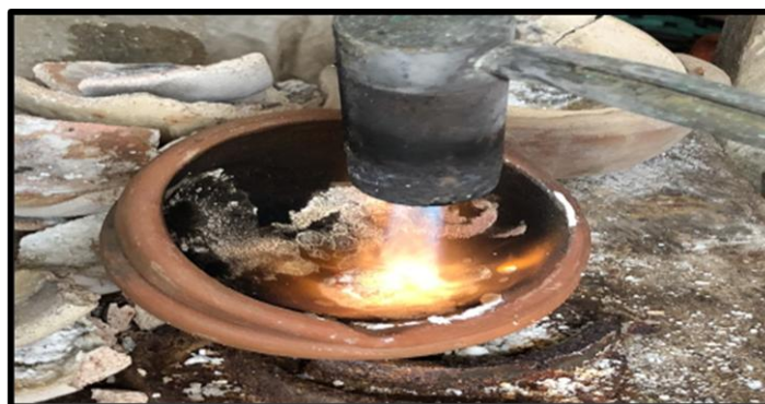
Gambar 4. Pemanasan Konsentrat Emas.