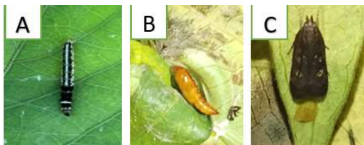
Gambar 1. Stadia perkembangan hama pelipat daun ( Brachmia convolvuli Wals.) Larva (A), Pupa (B), Imago (C).

Serangan hama pelipat daun Brachmia convolvuli Wals. pada tanaman ubi jalar ditandai dengan adanya daun yang melipat atau menggulung akibat aktivitas larva yang hidup dan berkembang di dalam lipatan daun tersebut. Larva memanfaatkan benang sutera halus untuk merekatkan bagian daun sehingga membentuk ruang perlindungan yang digunakan sebagai tempat makan sekaligus tempat berlindung dari gangguan lingkungan maupun predator alami. Larva umumnya berwarna hitam dengan pola dengan pola garis putih dengan bentuk tubuh memanjang dan memiliki bagian kepala yang lebih gelap.