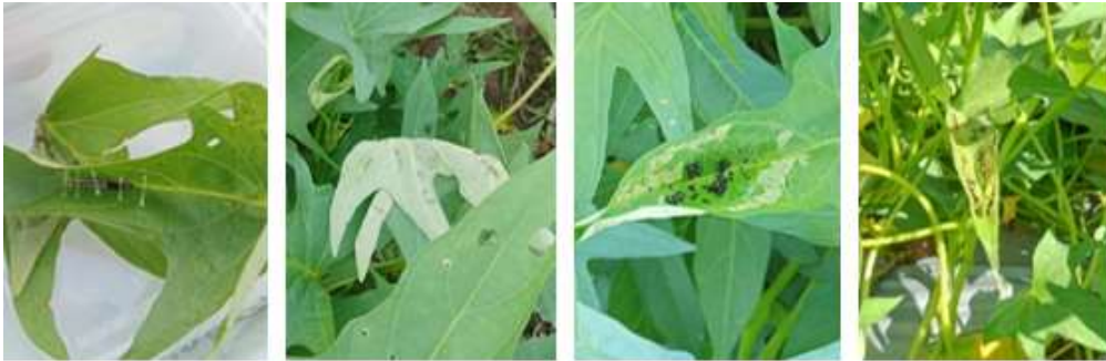
Gambar 2. Gejala Serangan Hama Ulat Pelipat Daun.

larva menyebabkan berkurangnya luas daun yang masih aktif melakukan fotosintesis, sehingga proses pembentukan energi dan pertumbuhan tanaman menjadi terganggu.