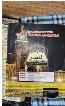
Gambar 2. Buku Prestasi (Mutabaah)