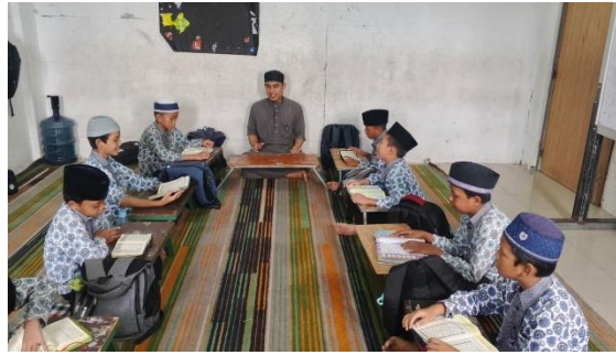
Gambar 1. Halaqah tahfiz