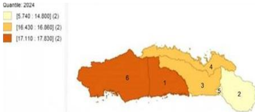
Gambar 1. Pola sebaran penduduk miskin di Provinsi Gorontalo.

Dengan bantuan software GeoDa, diperoleh peta sebaran persentase penduduk miskin di Provinsi Gorontalo sebagai berikut.