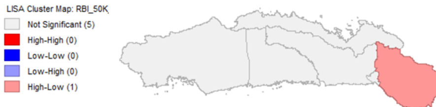
Gambar 4. LISA Cluster Map Data Kemiskinan Tahun 2024.

Di sisi lain, terdapat satu daerah yang memiliki hasil yang signifikan, yaitu Kabupaten Bone Bolango, dengan nilai indeks LISA sebesar -0,000431 dan p -value = 0,001. Meskipun nilai indeksnya negatif dan kecil, namun signifikansi yang tinggi menunjukkan adanya indikasi autokorelasi spasial negatif lokal yang kuat. Ini berarti Kabupaten Bone Bolango cenderung menjadi outlier spasial, yang nilai kemiskinannya sangat berbeda dari wilayah sekitarnya. Berdasarkan LISA cluster map untuk data kemiskinan tahun 2024 ditunjukkan dalam Gambar 4.