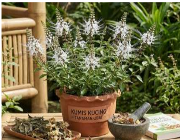
Gambar 4. Kumis Kucing ( Orthosiphon aristatus ) sebagai Tanaman Obat.

Kumis kucing ( Orthosiphon aristatus ) merupakan tanaman tropis yang banyak ditemukan di Asia Tenggara, khususnya Indonesia, Malaysia, dan Thailand. Tanaman ini dikenal dalam pengobatan tradisional sebagai agen diuretik, antiinflamasi, dan penghambat pertumbuhan mikroorganisme. Selain itu, kumis kucing juga memiliki potensi antikanker karena kandungan senyawa bioaktifnya, terutama flavonoid dan fenolik. Kandungan fitokimia dalam daun kumis kucing dapat bervariasi tergantung kondisi lingkungan, metode ekstraksi, dan fase pertumbuhan tanaman, yang secara langsung mempengaruhi aktivitas farmakologisnya. Penelitian ilmiah modern memanfaatkan analisis kromatografi dan spektrofotometri untuk memetakan kandungan senyawa aktif dalam daun, sehingga dapat mendukung pengembangan terapi berbasis tanaman (Hadiyanti & Mariyono, 2019).