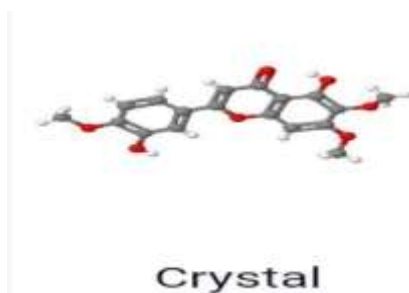
Gambar 3. Gambar Eupatorin Crystal dari PubChem.

Metode analisis senyawa bioaktif kumis kucing termasuk spektrofotometri, kromatografi lapis tipis, dan kromatografi cair kinerja tinggi, yang digunakan untuk menentukan profil flavonoid dan fenolik. Penelitian juga menekankan pentingnya pemilihan pelarut ekstraksi, karena berbeda pelarut menghasilkan kandungan senyawa yang berbeda dan berpengaruh pada aktivitas farmakologis. Misalnya, ekstraksi dengan etanol 70% dan 96% menghasilkan perbedaan aktivitas antijamur terhadap Candida albicans . Hasil ini mendukung pentingnya optimasi metode ekstraksi untuk memaksimalkan kandungan senyawa aktif yang bertanggung jawab terhadap efek terapeutik kumis kucing (Oktavian, Purbosari, & Hardani, 2023).