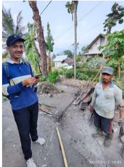
Gambar 5. Kegiatan kerja bakti membangun kandang di desa Besowo