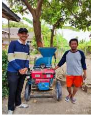
Gambar 7. Alat bersama yang didaptakan oleh kelompok ternak

Desa Besowo menciptakan hubungan timbal balik yang kuat antara warganya, terutama ketika menghadapi tantangan seperti musim kemarau. Kesadaran akan musim kemarau membawa masyarakat untuk bersama-sama mengatasi masalah tersebut melalui inisiatif seperti kumpul tani. Dalam pertemuan tersebut, masyarakat secara kolaboratif membahas strategi dan solusi untuk mengatasi dampak kemarau pada pertanian dan peternakan. Para peternak juga memanfaatkan sarana prasarana yang dimiliki oleh kelompok ternak, seperti motor pickup dan mesin chopper, secara bersama-sama. Motor pickup digunakan untuk mengangkut pakan atau hewan ternak, sementara mesin chopper menjadi aset yang dapat dimanfaatkan secara kolektif. Inisiatif ini menciptakan saling ketergantungan di antara warga Desa Besowo, di mana setiap anggota komunitas berkontribusi dan mendapatkan manfaat dari kolaborasi bersama. Hubungan timbal balik yang terjalin tersebut menjadi modal sosial yang berharga dalam menghadapi tantangan dan mendorong keberlanjutan di tingkat desa.