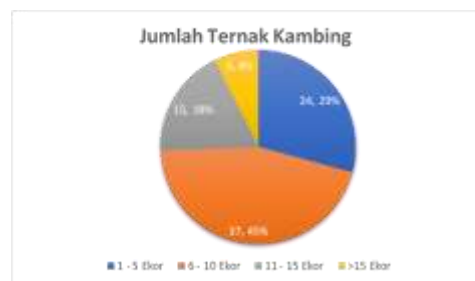
Gambar 3. Jumlah kepemilikan ternak kambing

Situasi di Desa Besowo mencerminkan pola umum di mana banyak masyarakat menjadikan ternak kambing sebagai kegiatan sampingan dalam kehidupan mereka. Ternak kambing dianggap sebagai bentuk tabungan yang dapat diandalkan ketika dana darurat dibutuhkan. Hal ini menandakan bahwa aktivitas beternak kambing bukanlah mata pencaharian utama, melainkan lebih sebagai alternatif untuk menghadapi kebutuhan mendesak secara finansial. Faktor ini dapat dipengaruhi oleh berbagai pertimbangan, termasuk keterbatasan waktu dan sumber daya yang dapat dialokasikan untuk kegiatan peternakan. Pemahaman mengenai peran kambing sebagai bentuk tabungan darurat dapat menjadi landasan untuk merancang program pembinaan yang dapat meningkatkan efektivitas dan manfaat dari kegiatan peternakan di Desa Besowo, serta mengoptimalkan peran ternak kambing dalam mendukung kesejahteraan masyarakat setempat.