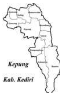
Gambar 1. Peta Kecamatan Kepung

Desa Besowo merupakan salah satu desa yang terletak di Kecamatan Kepung Kabupaten Kediri Provinsi Jawa Timur. Desa Besowo sendiri memiliki luas wilayah 10.137,63 ha dengan jumlah penduduk sebanyak 77.690 jiwa letak geografis Desa Besowo dapat dilihat pada gambar dibawah.