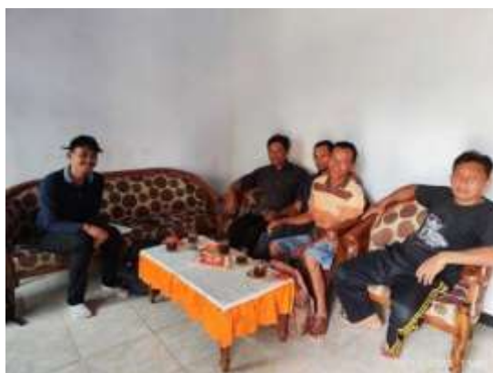
Gambar 6. Kelompok ternak Besowo Timur (Sumber : Dokumentasi penelitian, 2023)

bahwa faktor jaringan tidak berpengaruh secara signifikan terhadap kinerja yang terjadi, dikarenakan memang di beberapa dusun di Desa Besowo belum memiliki suatu hal yang terikat, sehingga tingkat kepedulian antar individu tidak terbentuk dengan baik Hal ini sebanding dengan Warmana dan Widnyana (2018) inerja dapat dipengaruhi oleh modal sosial yang dimiliki individu dalam jaringan pribadinya yang terikat akan suatu hal. Hal ini membuat jaringan yang terjalin di Desa Besowo tidak terlalu mempengaruhi kinerja peternak di Desa Besowo, akan tetapi dikarenakan adanya kelompok ternak yang bernama rojomulyo yang diisi oleh masyarakat Dusun Besowo Timur yang berprofesi sebagai peternak kambing sehingga berbagai informasi terkait ternak mudah dilakukan yang tidak terjadi pada Dusun selain Besowo timur yang tidak memiliki kelompok ternak sehingga jaringan informasi yang didapat tidak tersebar sebaik yang memiliki kelompok ternak.